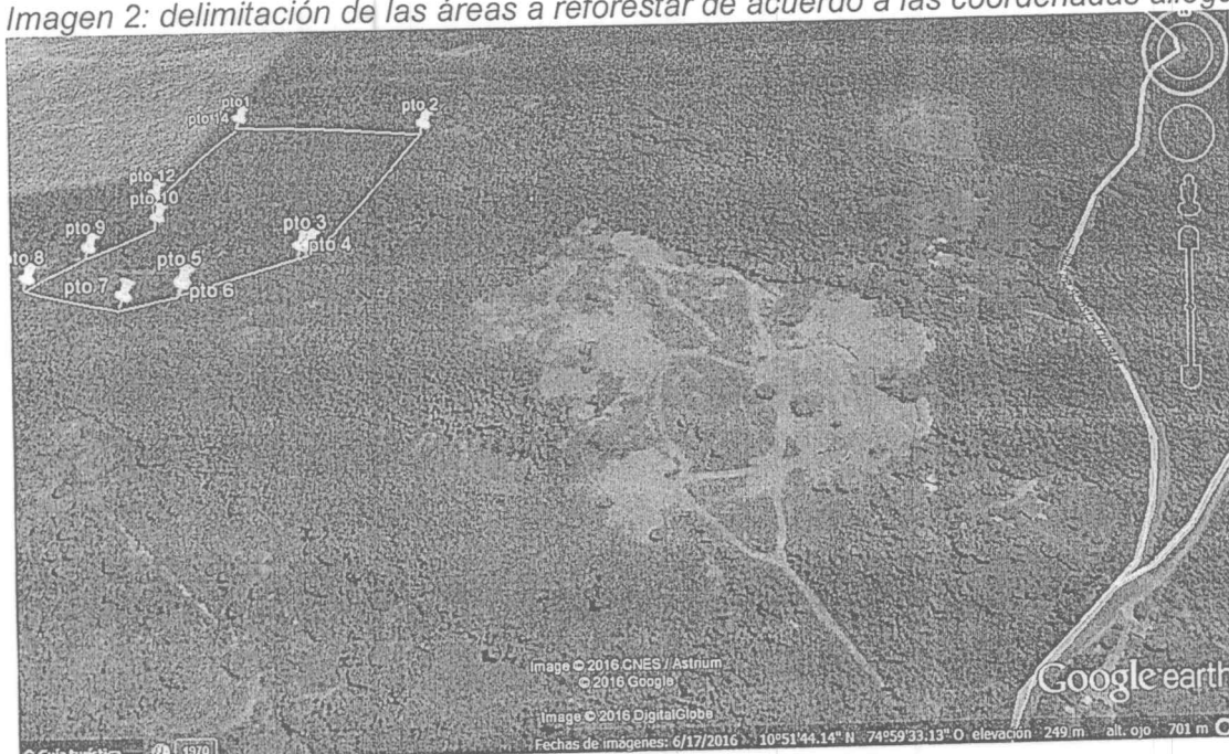
Imagen 2: delimitación de las áreas a reforestar de acuerdo a las coordenadas allegadas

Además es pertinente precisar que las coordenadas presentadas se ubican en la siguiente área: